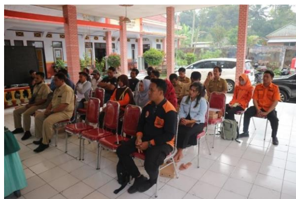
Gambar 7. Observasi dan Monitoring

Proses monitoring merupakan langkah krusial dalam setiap program pendampingan sosial. Ini memastikan bahwa semua kegiatan yang telah direncanakan dapat berjalan sesuai dengan harapan dan mendapatkan hasil yang maksimal. Tahap ini juga memberikan kesempatan bagi tim pelaksana untuk melakukan koreksi dan perbaikan, jika ditemukan hambatan atau kesalahan dalam pelaksanaan. Oleh karena itu, tim aktif memberikan pendampingan kepada kelompok dalam pelaksanaan kegiatan yang telah dirancang. Pendampingan ini diwujudkan dalam bentuk kunjungan lapangan, diskusi rutin, dan evaluasi berkala.