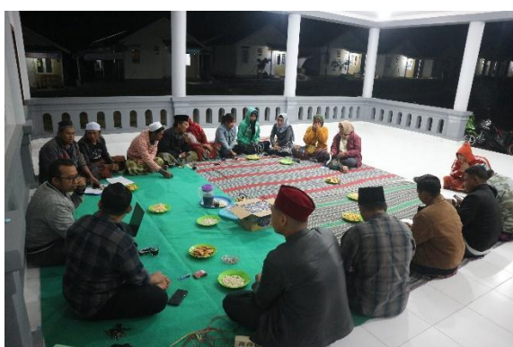
Gambar 6. Bimbingan Teknis terkait Rukun Kematian

vital. Oleh karena itu, bimbingan teknis terkait rukun kematian diselenggarakan sebagai bagian dari pendampingan sosial. Dalam fase ini, Tim Pelaksana berperan aktif memberikan bimbingan teknis kepada kelompok pendamping mengenai berbagai hal terkait rukun kematian. Mengingat kompleksitas dan sensitivitas topik ini, diperlukan pendekatan yang detail dan hati-hati. Oleh karena itu, tim memastikan bahwa materi bimbingan teknis disampaikan dengan cara yang mudah dipahami, namun tetap mendalam dan sesuai dengan prinsip syariah.