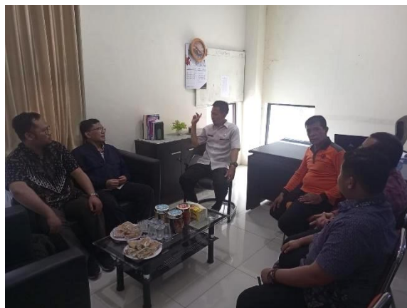
Gambar 1. Dokumentasi Koordinasi dan Kajian Kebutuhan dengan BPBD Kabupaten Lumajang

Diskusi dengan BPBD dimulai dengan pemahaman umum mengenai dampak bencana, data korban, serta area-area yang paling parah terkena dampak. Selain itu, BPBD juga menyampaikan mengenai upaya-upaya yang telah dilakukan sejauh ini, termasuk tantangan dan hambatan yang dihadapi dalam pelaksanaannya. Dengan demikian, tim pendamping bisa mendapatkan gambaran yang lebih jelas mengenai situasi di lapangan dan mengidentifikasi celah atau kebutuhan pendampingan yang belum terpenuhi. Selain itu, diskusi ini juga menjadi forum bagi tim pendamping untuk menyampaikan rencana, pendekatan, serta metode pendampingan yang akan dilakukan. Hal ini memungkinkan adanya sinergi antara BPBD dan tim pendamping, sehingga upaya pendampingan yang dilakukan bisa lebih terkoordinasi dan terintegrasi dengan program penanggulangan bencana yang telah ada.