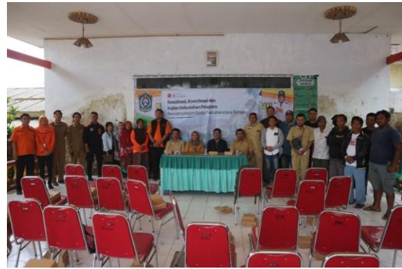
Gambar 5. Koordinasi, Sosialisasi, dan Kajian Kebutuhan dengan Stakeholders

dengan mengundang praktisi yang kompeten di bidangnya. Hal ini bertujuan untuk memastikan bahwa masyarakat memiliki pemahaman yang benar dan mendalam tentang tata cara pemakaman sesuai dengan syariat, meski dalam kondisi keterbatasan.