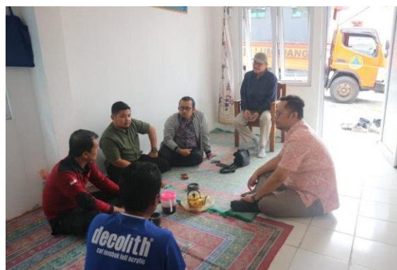
Gambar 4. Diskusi Informal Tim Universitas Brawijaya ke Hunian Tetap Fasilitasi Koordinasi dengan Stakeholder

lam mendapatkan akses mengenai keagamaan. Misalnya, hilangnya beberapa acara rutin keagamaan dan kurangnya infrastruktur dan pengetahuan mengenai rukun kematian. Pada akhir diskusi dapat disimpulkan bahwa masyarakat memerlukan pendampingan lebih lanjut terkait proses rukun kematian.